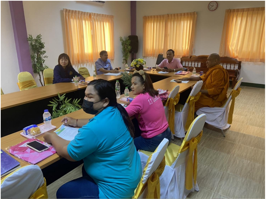
๓. ภาพประกอบการประชุมคณะกรรมการสถานศึกษาขั้นพื้นฐานโรงเรียนบ้านโนนท่อนวิทยา ครั้งที่ ๑/๒๕๖๖